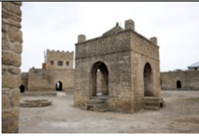
バクー郊外 拝火教寺院