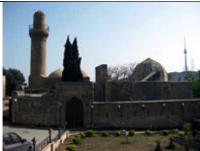
バクー シルヴァン・シャフ・ハーン宮殿