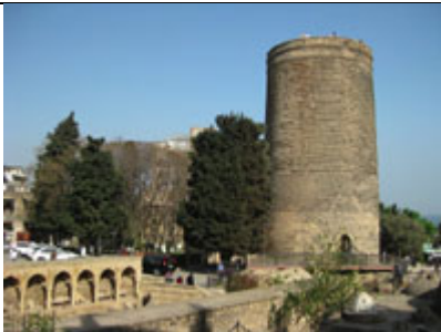
バクー 乙女の望楼