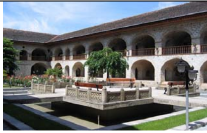
シェキ キャラヴァン・サライ