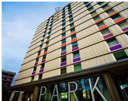
リュブリャナ Hotel Park

宿泊施設：スタンダードクラス 以下のホテルが満室の場合は同等クラスのホテルをご案内致します