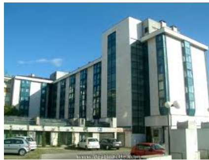
ザグレブ Hotel Laguna