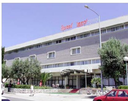
ドブロブニク Hotel Lero