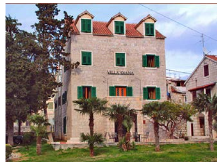
スプリット Hotel Vila Diana