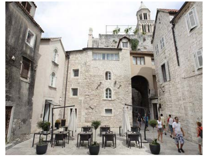
スプリット Hotel Vestibul