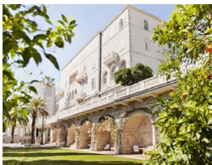
ドブロブニク Grand Villa Hotel Argentina

宿泊施設：スタンダードクラス 以下のホテルが満室の場合は同等クラスのホテルをご案内致します