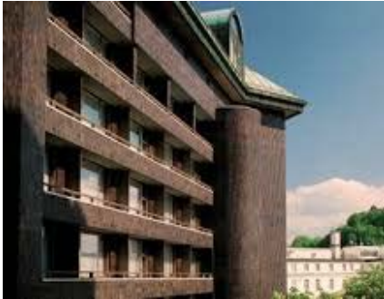
リュブリャナ Grand Hotel Union Business

宿泊施設：スーパーリアクラス 以下のホテルが満室の場合は同等クラスのホテルをご案内致します