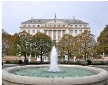
ザグレブ Hotel Esplanade