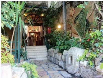
エルサレム Jerusalem Hotel