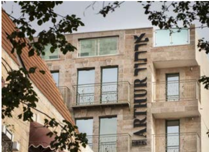
エルサレム Arthur Hotel