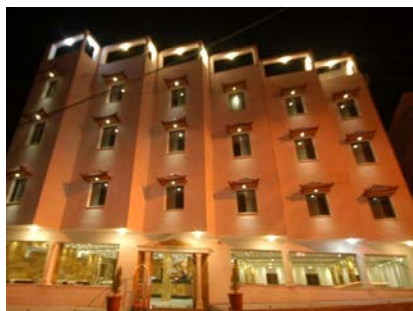
ペトラ Sharah Mountains Hotel