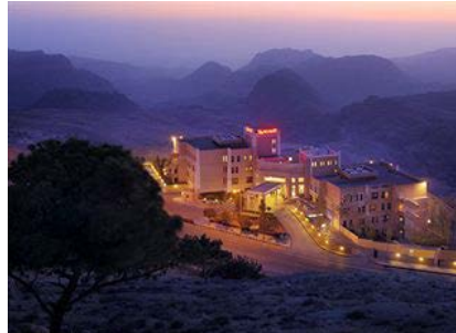
ペトラ Petra Marriott Hotel