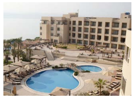
死海 Dead Sea Spa Hotel