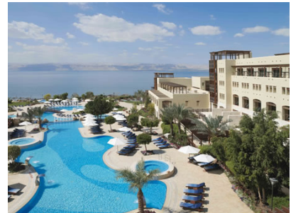
死海 Dead Sea Marriott Hotel