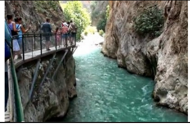
サクルケント溪谷